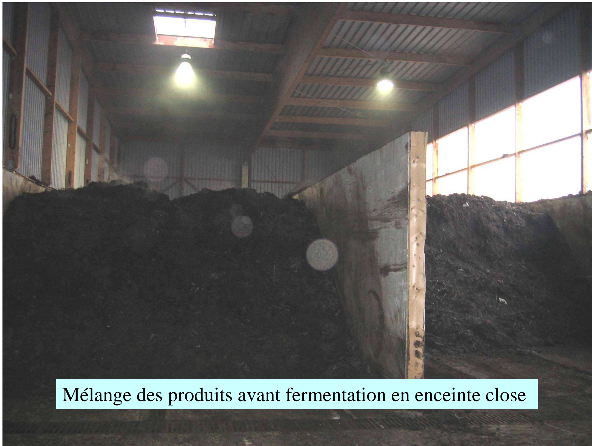
Mélange des produits avant fermentation en enceinte close