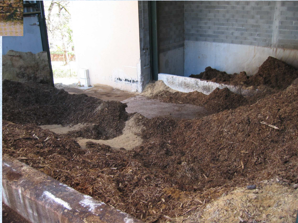
Aire de stockage et silo